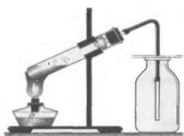
Şəkil 1. Havanı sıxışdırıb çıxarmaqla oksigenin yığılması

Şagirdlər müəllimin köməyi ilə oksigen almaq üçün ən əlverişli maddə (prosesin sadə olması və maddənin asan parçalanmasına görə) hesab edilən kalium-permanqatdan oksigenin alınmasına aid təcrübə aparırlar. Alınan oksigenin fiziki xassələri əyani olaraq müşahidə edilir və müvafiq qaydalarla bir neçə şüşə banka doldurulur. Oksigenlə dolu bankalara havada dəmir qaşığıda yandırılmış kükürd, kömür və dəmir (polad) məftil salınaraq onun kimyəvi xassələri öyrənilir.