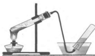
Şəkil 2. Suyu sıxışdırıb çıxarmaqla oksigenin yığılması