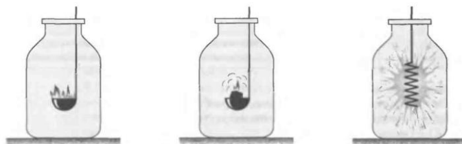
Şəkil 3. Kükürdün (a), kömürün (b) və dəmirin (c) oksigendə yandırılması.

Sonra oksigeni almaq üçün kalium-xlorat və hidrogen-peroksidin parçalanması təcrübələri aparılır. Bu zaman şagirdlər oksigenin zəif alındığını müşahidə etdikdən sonra müəllim həmin maddələr olan sınaq şüşələrinə bir qədər manqan(IV)oksid ( MnO_2 ) əlavə edir və oksigenin sürətlə çıxması müşahidə edilir. Hidrogen-peroksid olan sınaq şüşəsində manqan(IV)oksidin olduğu kimi qalmasını şagirdlər əyani olaraq görürlər. Bu reaksiyalarda manqan(IV)oksidin katalizator olması barədə məlumat verilir və şagirdlər baş verən prosesin mahiyyətini dərk edərək, özləri katalizatorun tərifini verirlər.