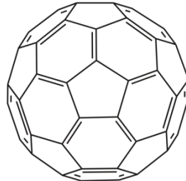
Fuleren ( C_{60} )

Fulleren ( C_{80} ) molekulunda kimyəvi rabitə saylarını riyazi hesablanması aşağıda verilmişdir.