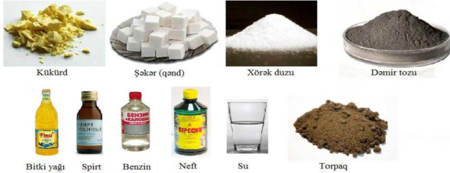
Şəkil 2. Maddələr

Sonra müəllim 1-ci və 2-cü şəkillərdəki maddələrin fiziki xassələri barədə nə deyə bilərsiniz? sualı ilə şagirdlərə müraciət edir.