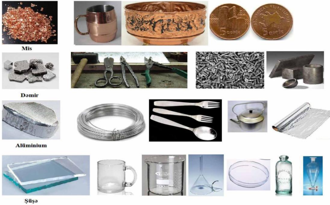
Maddələr Şəkil 1.

Verilən suallar cavablandırıldıqdan sonra müəllim stolun üzərinə yığılmış müxtəlif cisim (əşya) və maddələri şagirdlərə qruplaşdırmağı təklif edir. Şagirdlər təklif olunan maddələr və onlardan hazırlanmış əşyaları 1-ci şəkildəki kimi qruplaşdırırlar.